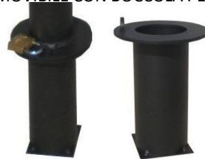
VERSIONE AMOVIBILE CON BOCCOLA PER LUCCHETTO