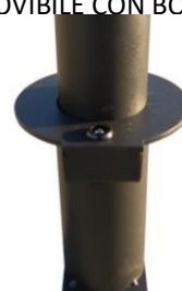
VERSIONE AMOVIBILE CON BOCCOLA CON CHIAVE