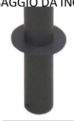
VERSIONE PER FISSAGGIO DA INGHISARE CON PIASTRA: