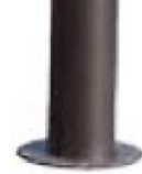
VERSIONE PER FISSAGGIO CON TASSELLI: