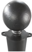
DISSUASORE CON ANELLI: